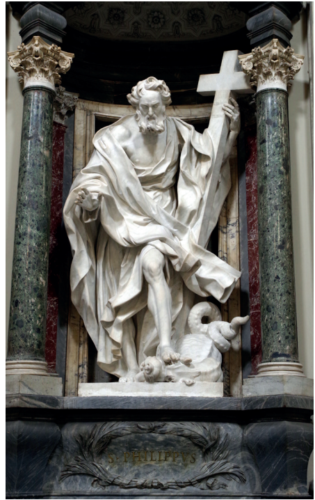
Statue de l'apôtre saint Philippe à la basilique Saint-Jean-de-Latran à Rome.

Philippe est considéré comme le saint patron des chapeliers et des pâtisseries. Il est fêté le 3 mai en Occident. 🏰