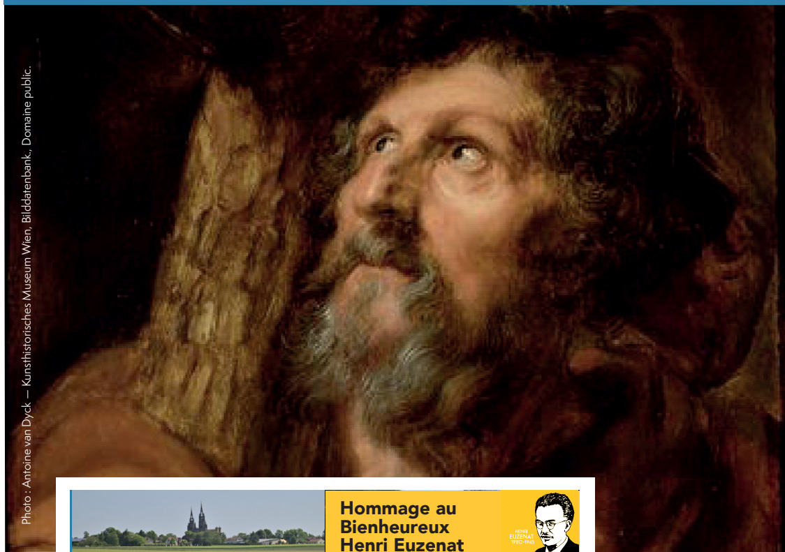
Photo : Antoine van Dyck — Kunsthistorisches Museum Wien, Bildatzenbank., Domaine public.