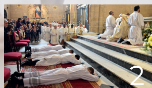
Ordination des diacres