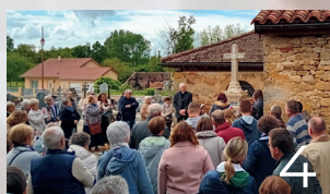
Visite Pastorale de découverte