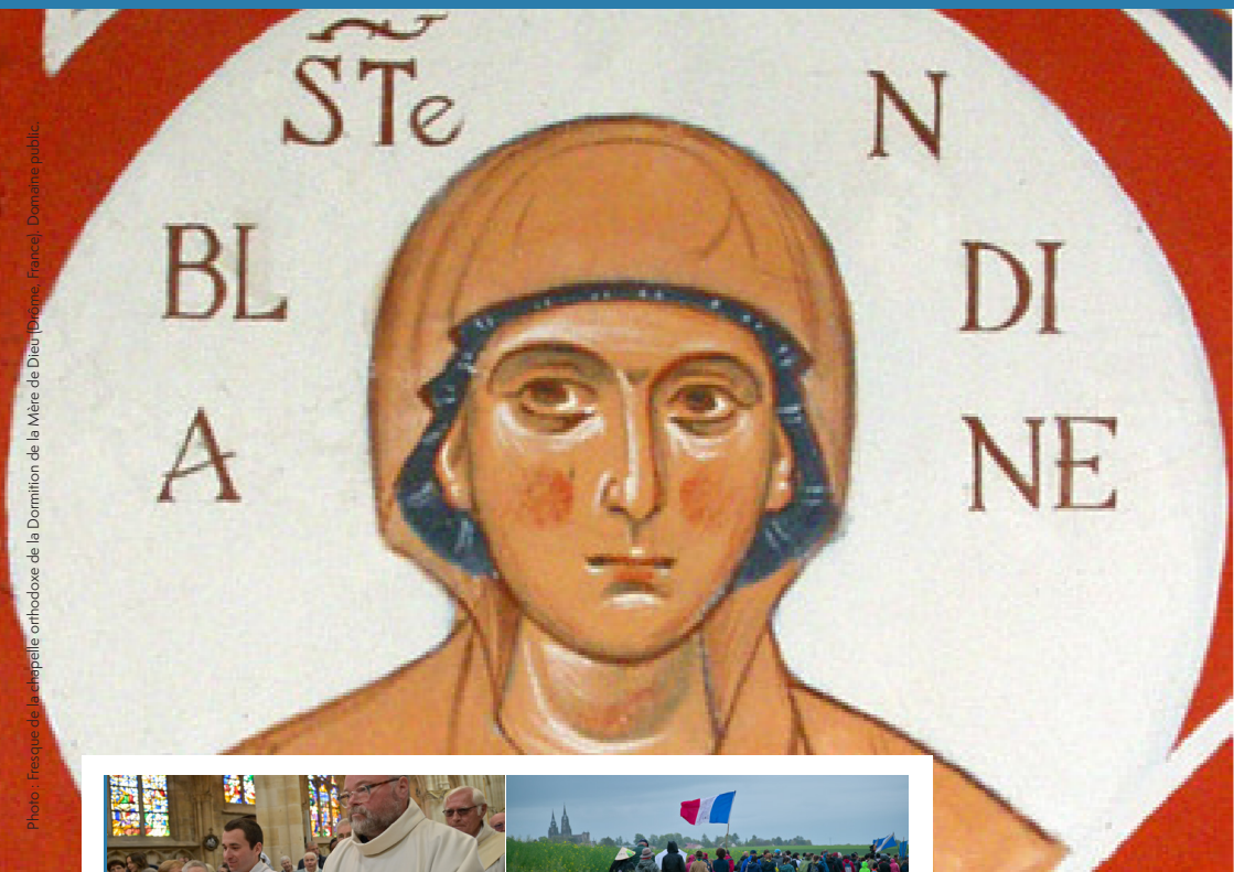
Photo : Fresque de la chapelle orthodoxe de la Dormition de la Mère de Dieu (Diocèse, France). Domaine public.