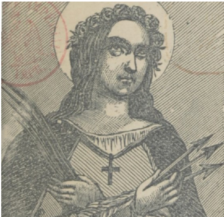
Auteur inconnu — Sainte Blandine, patronne des servantes et les compagnons de son martyre, 1867. Wikimedia Commons.

Ô sainte Blandine, toi qui fus forte de la force de Dieu, apprends-nous à rester fidèles dans les épreuves de la vie. Humble servante devenue lumière, donne-nous ton courage paisible quand la peur nous envahit, quand notre ciel s'obscurcit. Toi qui n'as jamais renié Jésus-Christ, aide-nous à l'aimer davantage chaque jour.