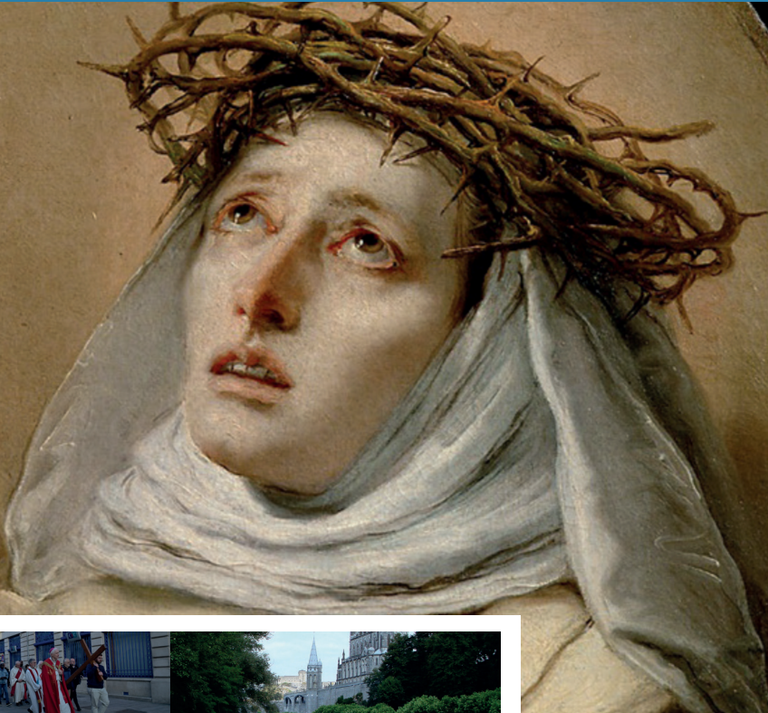
Photo Catherine de Sienne Giambattista Tiepolo, vers 1746 Kunsthistorisches Museum, Vienne