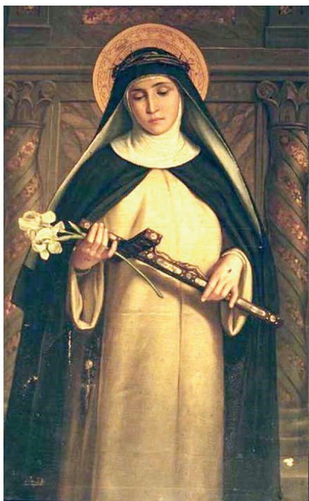
Catherine de Sienne portant sur son voile la couronne d'épines, tenant un crucifix et une fleur de lys.

C'est un dialogue entre Dieu le Père et l'âme. Ce dialogue est une théologie de l'amour divin, sa spiritualité repose sur l'amour ardent, la vérité, la réforme intérieure de l'Église et l'union intime avec le Christ. 🏰