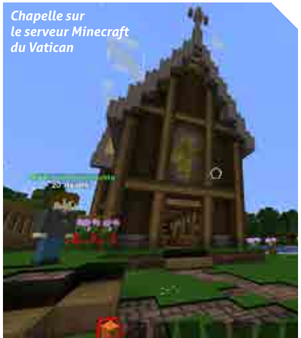
Chapelle sur le serveur Minecraft du Vatican

ce jeu mêlant espoir et désespoir, vous êtes enfermés avec 14 amis et cherchez un moyen de vous échapper. Certains perdront espoir et choisiront la violence, d'autres choisiront l'espoir. Vous incarnez Makoto Naegi, aussi appelé « l'ultime espoir ». Pas mal !