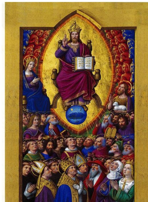
Œuvre de Jean BOURDICHON, enluminure tirée du livre Les Grandes Heures d'Anne de Bretagne, Bibliothèque National de France, Paris