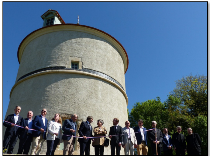
Inauguration le 29 avril 2025

Après son inauguration solennelle le 29 avril 2025, il faut souhaiter maintenant longue vie au pigeonnier même s'il est peut-être nostalgique aujourd'hui de ne plus entendre le roucoulement régulier des pigeons !