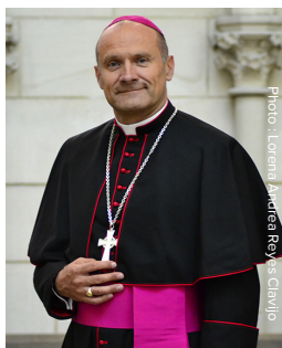
✠ François TOUVET Évêque de Châlons

La question demeure : voulons-nous annoncer l'Évangile ? ou nous résignons-nous à ce qu'il n'y ait bientôt plus de chrétiens dans nos villes et villages ? Quelle sera la première paroisse à oser se lancer dans cette aventure ?