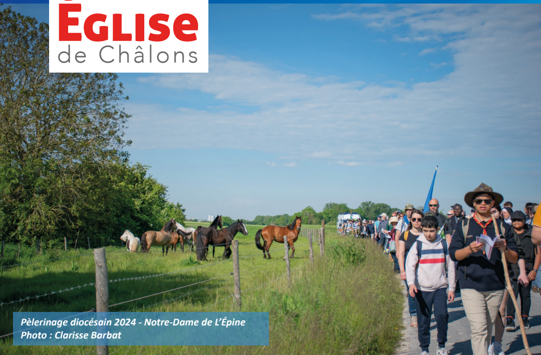
Pèlerinage diocésain 2024 - Notre-Dame de L'Épine