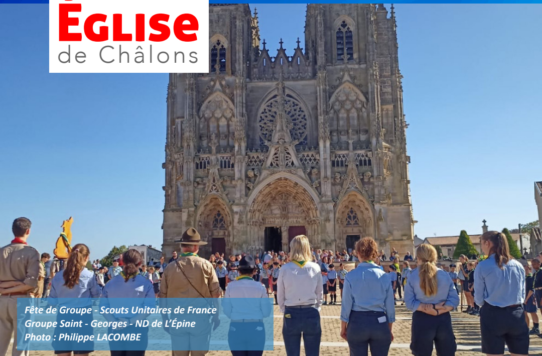
Fête de Groupe - Scouts Unitaires de France Groupe Saint - Georges - ND de L'Épine