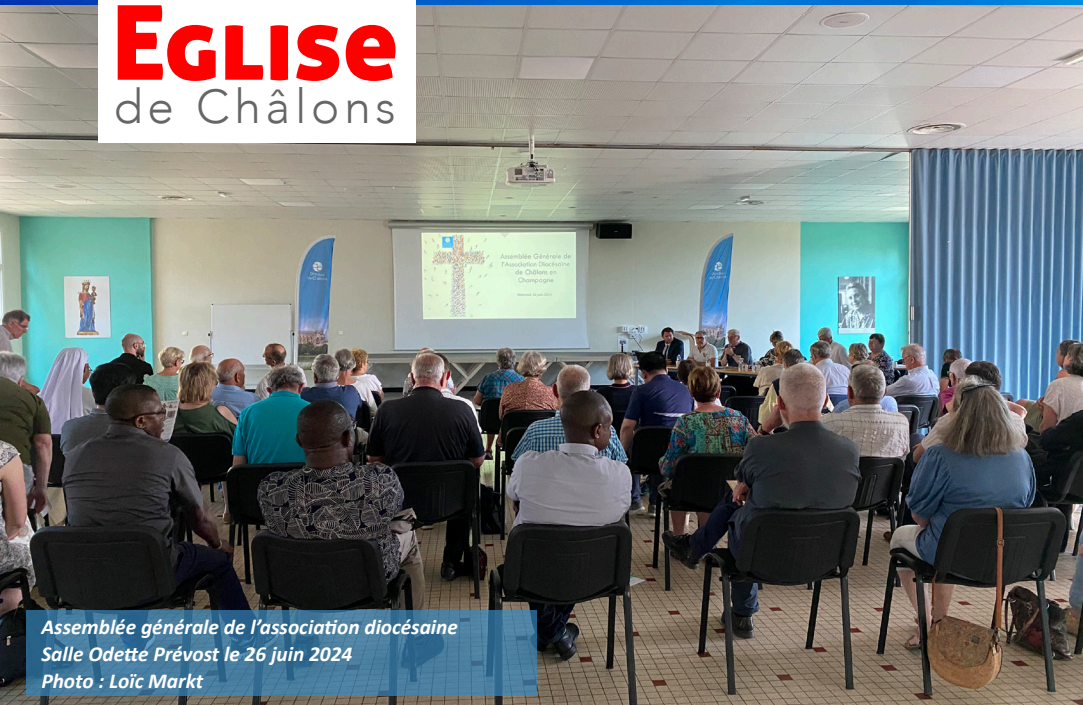
Assemblée générale de l'association diocésaine Salle Odette Prévost le 26 juin 2024