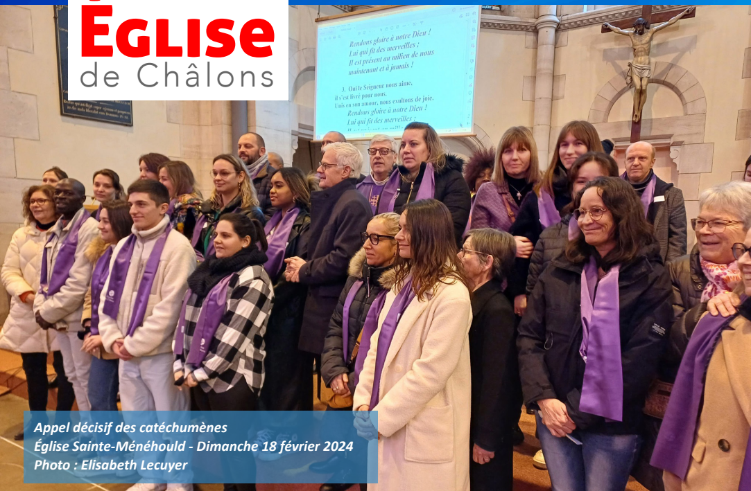
Appel décisif des catéchumènes Église Sainte-Ménéhould - Dimanche 18 février 2024