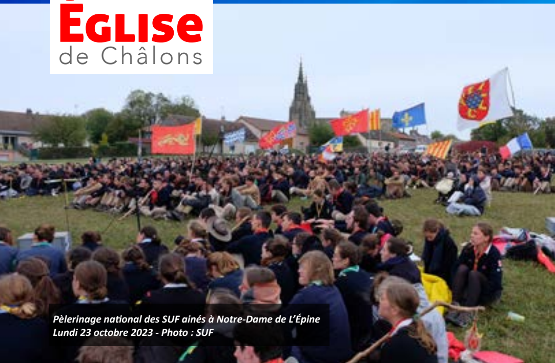
Pèlerinage national des SUF aînés à Notre-Dame de L'Épine Lundi 23 octobre 2023