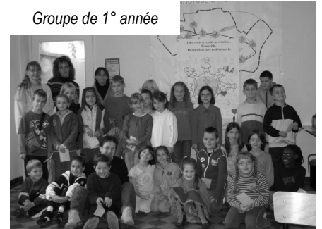
Groupe de 1 ère année

L'aveugle est aussi l'occasion pour les groupes de 1 ère , 2 ème et 3 ème année de prolonger ce thème de la solidarité et de l'attention aux plus petits dans la découverte et l'étude de deux évangiles de Saint Luc : le bon samaritain (Luc 10,25-37) et Zachée (Luc 19,1-10).