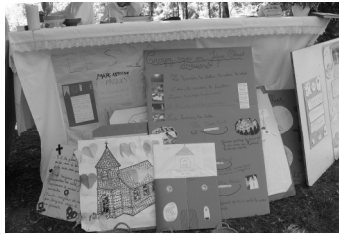
Réalisations des groupes durant l'année de caté 2005-2006

Lors de la messe du Mont Aimé du 2 juillet les groupes de caté ont présenté leur réalisation de l'année (panneau, bricolage...).