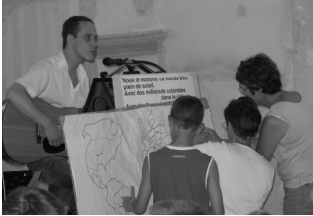
Remise en place des 14 pays sur le planisphère

Souvenez-vous, l'année de catéchèse 2005-2006 s'était terminée avec la journée festive du mercredi 29 juin 2006 à Coligny. Sur le thème du « Mondial KT », une centaine d'enfants répartis en 14 équipes avaient découvert 14 pays en jouant de la tête et des jambes. La journée s'était finie par une célébration à l'église de Coligny avec la participation musicale de Grégory Turpin, animateur diocésain, certains enfants mimant la parabole du bon samaritain.