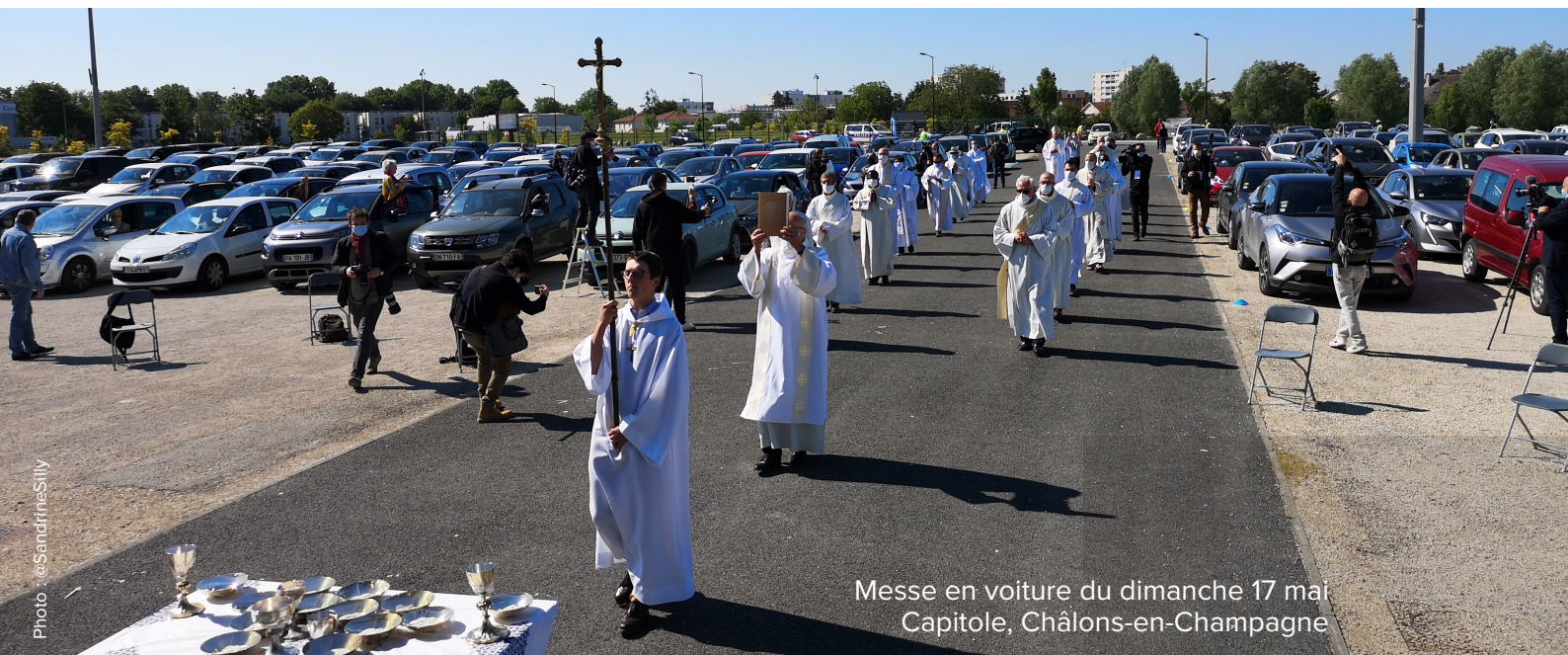
Messe en voiture du dimanche 17 mai Capitole, Châlons-en-Champagne