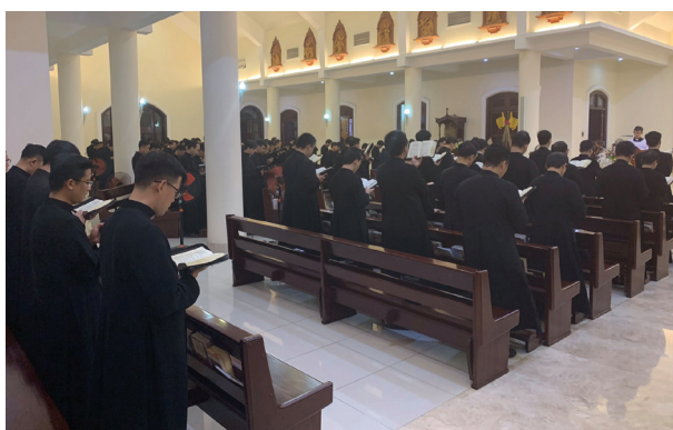
Au grand Séminaire de Saigon, Vêpres de l'Épiphanie avec les 250 séminaristes