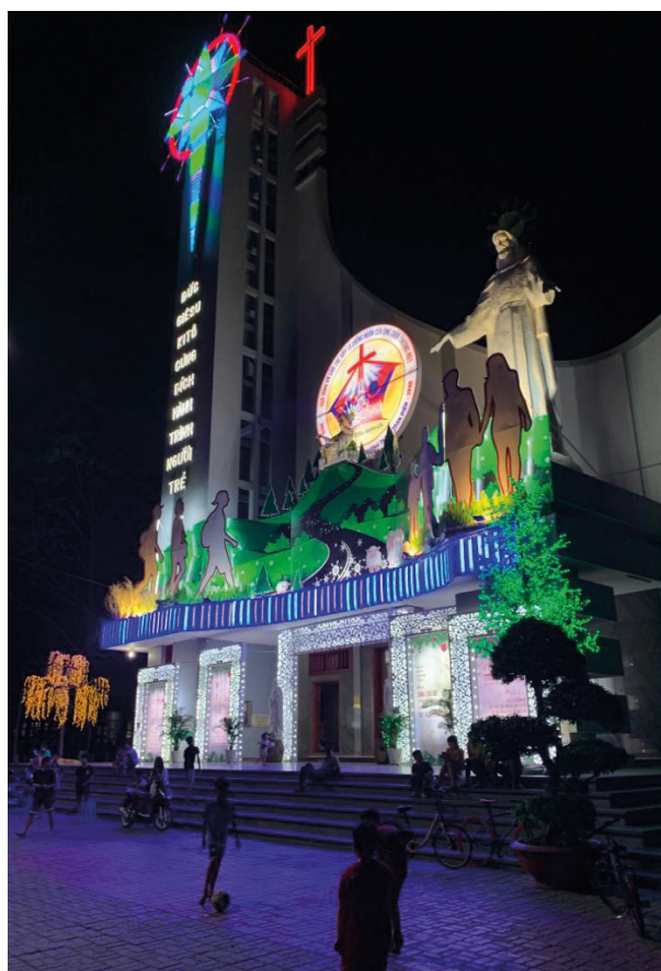
Crèche géante sur une façade d'église