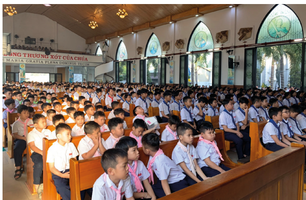
Messe du dimanche matin pour 400 enfants avant le catéchisme